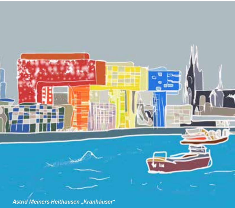
Astrid Meiners-Heithausen „Kranhäuser“